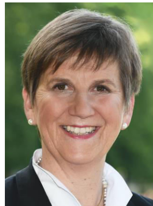
Mitglied des Deutschen Bundestag